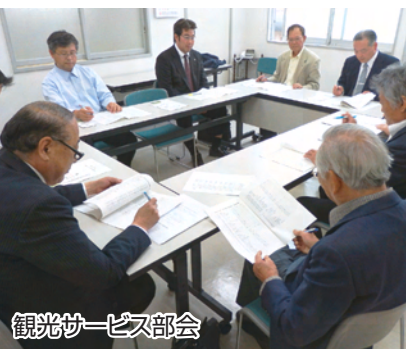
観光サービス部会