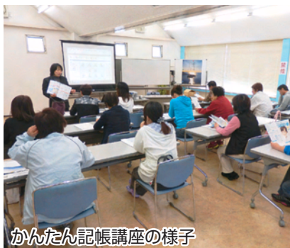
かんたん記帳講座の様子

ひと昔であれば、パソコンを使って帳簿を作成する...なんていうとハードルが高く感じられましたが、今は操作もとても簡単で、かえって手書きで帳簿をつけるほうが大変なくらい。今回の講習会を通じて参加した多くの方々のハードルが下げられたように感じました。