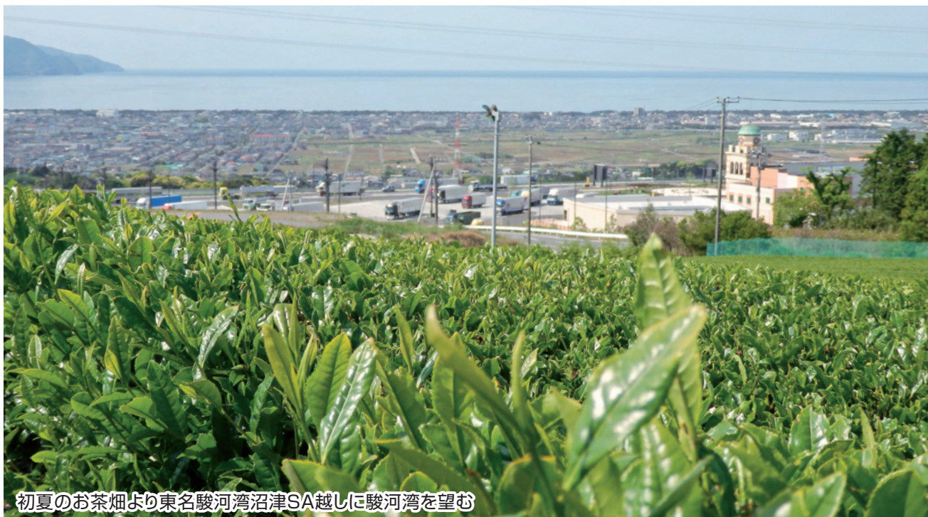
初夏のお茶畑より東名駿河湾沼津SA越しに駿河湾を望む

No. 63 発行者 沼津市商工会 会長 大村保二 〈本所・原支所〉沼津市原1200番地の1 TEL(055)966-1331 FAX (055)967-4925 〈戸田支所〉沼津市戸田1028番地の5 TEL(0558)94-2224 FAX (0558)94-4029 編集 沼津市商工会広報委員会